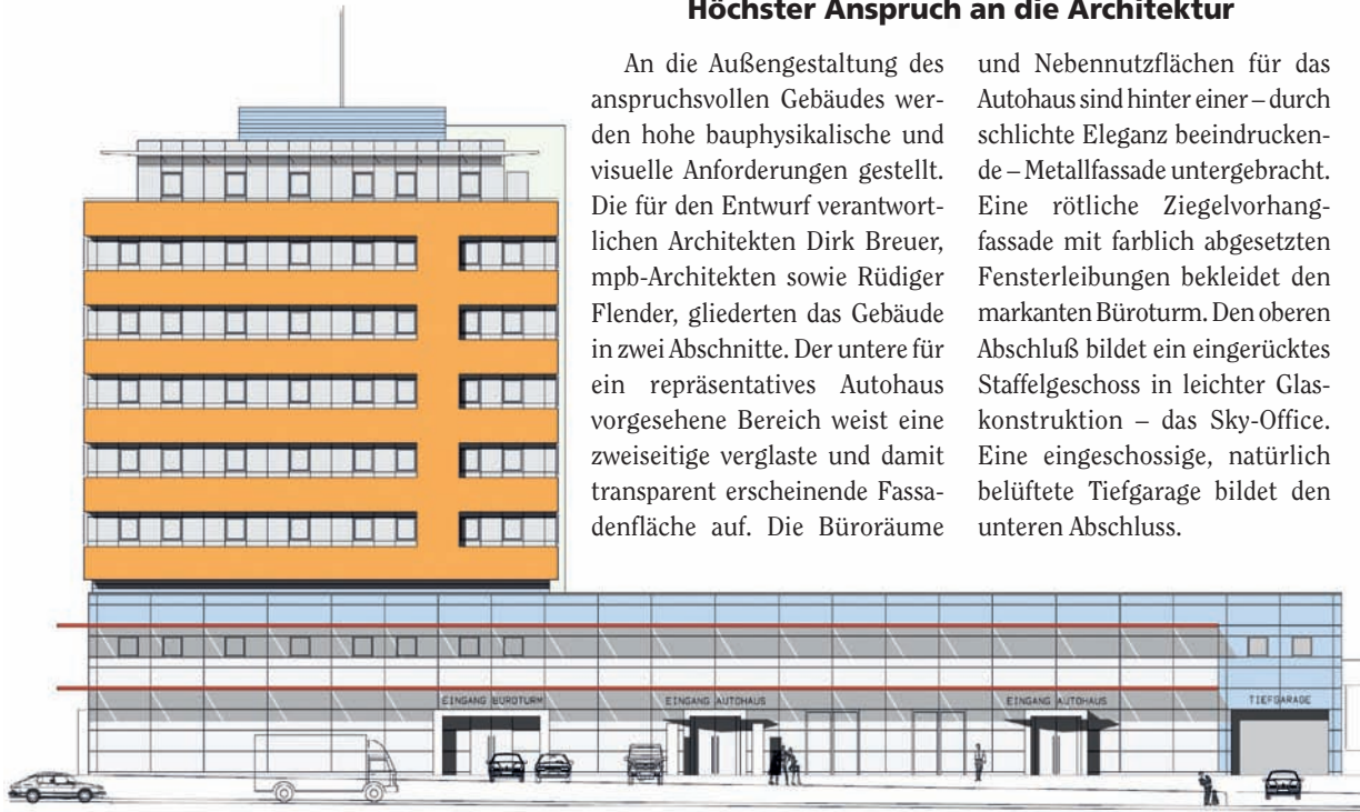
Ansicht Neuenhof- straße

und Nebennutzflächen für das Autohaus sind hinter einer – durch schlichte Eleganz beeindruckende – Metallfassade untergebracht. Eine rötliche Ziegelvorhangfassade mit farblich abgesetzten Fensterleibungen bekleidet den markanten Büroturm. Den oberen Abschluß bildet ein eingerücktes Staffelgeschoss in leichter Glas-konstruktion – das Sky-Office. Eine eingeschossige, natürlich belüftete Tiefgarage bildet den unteren Abschluss.